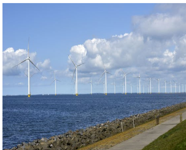
Het hardst groeide wind op zee, door de plaatsing van 600 megawatt aan windmolens op zee.

In totaal werd in 2016 125 petajoule hernieuwbare energie verbruikt, 5% meer dan in 2015. Bijna tweederde daarvan komt uit biomassa. Het verbruik van wind- en zonne-energie steeg met ruim 20%, maar maakt nog altijd minder dan 30% uit van het totale hernieuwbare energieverbruik. Het hardst groeide wind op zee,